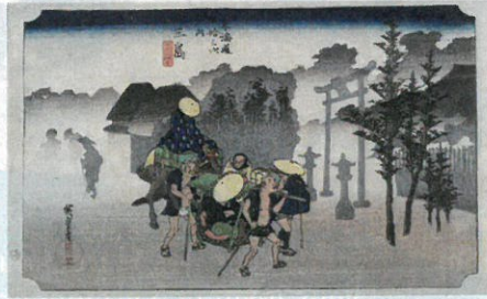
Des bonsaï, du taiko, des estampes... Ou trois facettes du Japon à découvrir à Mulhouse